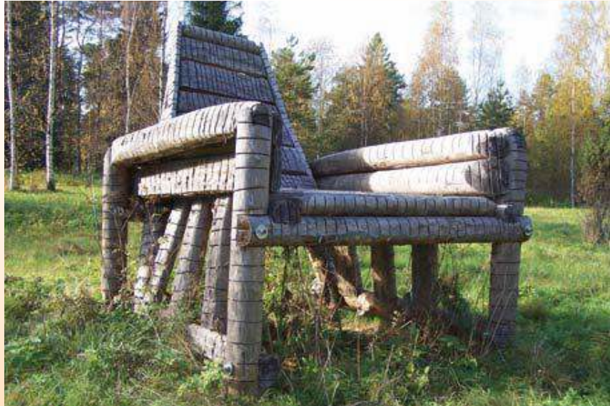
Antti Pedrozon teos Valtaistuim Pohjanmaantien varrella Kankaanpään keskustassa – kansan suussa Kaken tuoli . (Maija Anttila)