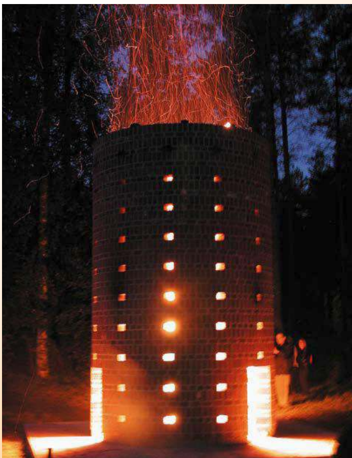
Pekka Paikkarin Uuniveistos syntyi Hehku- näyttelyyn kankaanpääläisten muurarien talkootyönä. (Maija Anttila)