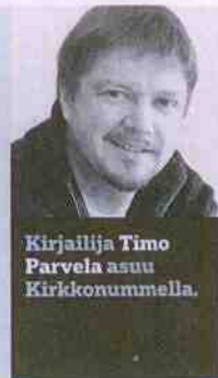
Kirjailija Timo Parvela asuu Kirkkonummella.

Moikkailu. Tervehdi kaikkia ihmisiä, jotka vilkai- sevat sinua. Voit valita asiallisen nyökkäämisen tai