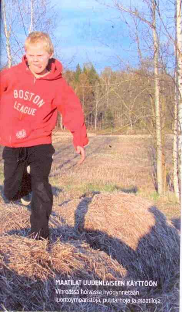
MAATILAT UUDENLAISEEN KÄYTTÖÖN Vihreässä höivässä hyödynnetään luontoympäristöjä, puutarhoja ja maatiloja.