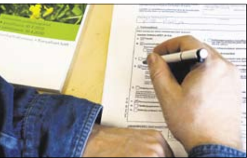
Maatiloilla täytetään lähiviikot ahkerasti lomakkeita.

Sairaalan päättäminen konkurssiin tuntuu vähintäänkin oudolta, koska Heinolan kaltaisia osaamiskeskittyimiä ei Suomesta löydy montaa. Olisi luullut, että erityisesti valtiovarainministeriö olisi huolehtinut sairaalan puuttuvasta rahoituksesta. Ministeriön edustajat ovat monia kertaan ihmetelleet ääneen, miksi kaikissa sairaanhoitopiirteissä pitää pyrkiä hoitamaan kaikkia sairauksia.