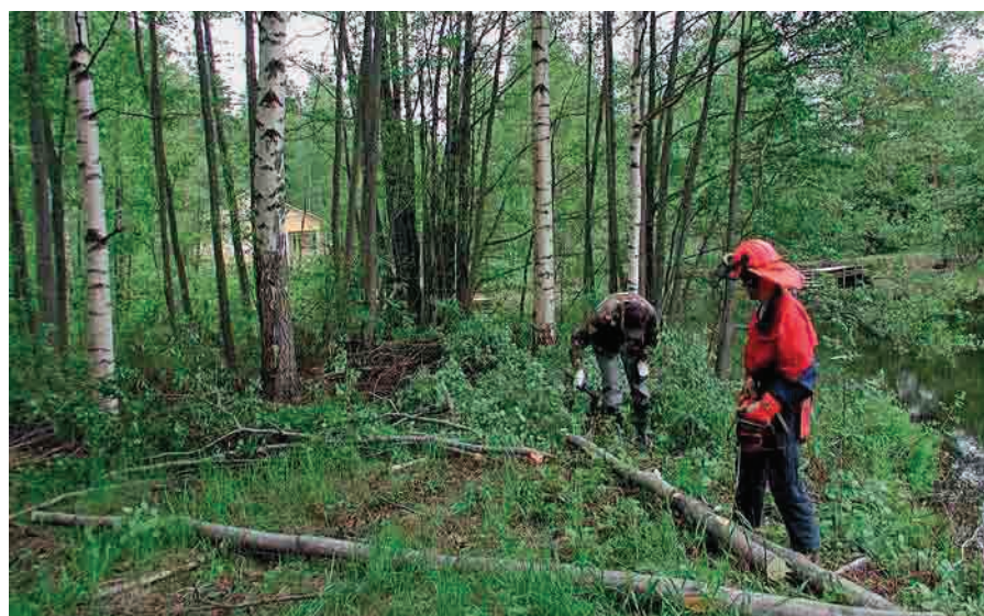
Puun kaatamisessa on aina muistettava työturvallisuus ja riittävä suojavaatetus.

muistilista vesikasvien niittäjälle helpottaa rannan kunnostamista ja lupa-asioiden hoitoa. Annettujen nettisivujen avulla löydät ammattitaitoisen yrittäjän avuksesi.