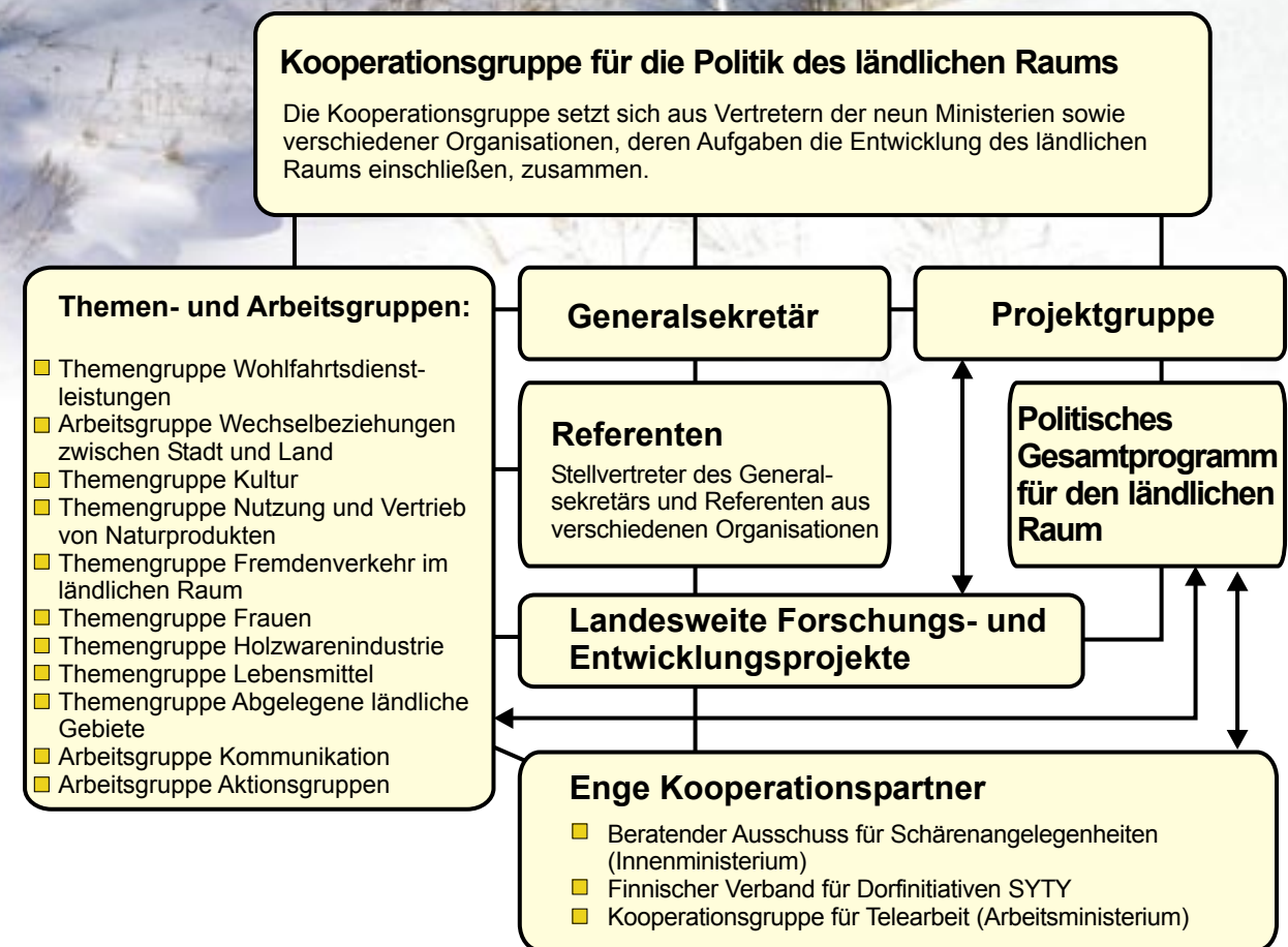
Abbildung 3. Kooperationsgruppe für die Politik des ländlichen Raums (31.7.2004)

Bildarchiv des Ministeriums für Landwirtschaft und Forsten