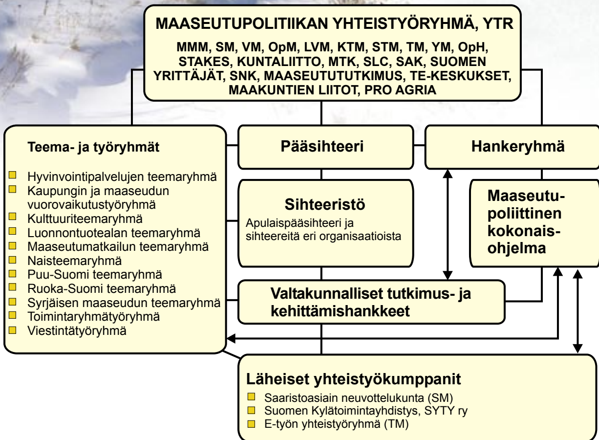
Kuva 3. Maaseutupolitiikan yhteistyöryhmä (tilanne 31.7.2004)