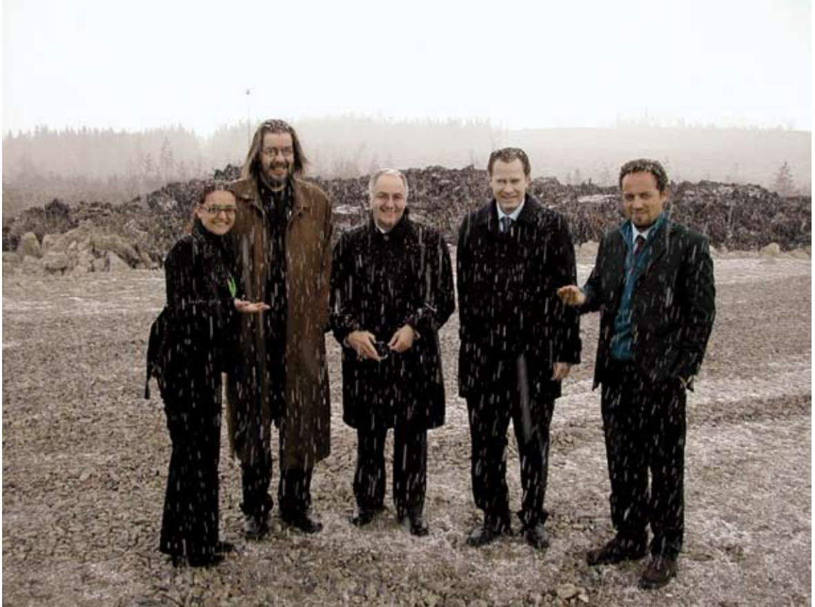
OECD:n edustajat nauttivat Suomen keväästä kenttävierailullaan. Kuva on Talvivaaran kaivokselta Sotkamosta 3.5.2007.

Kenttäkierrosten jälkeen OECD:n maatutkintaryhmä valmisteli luonnoksen raportista ja toimitti sen ohjausryhmälle, jonka kommenttien pohjalta OECD muokkasi raportin valmiiksi.