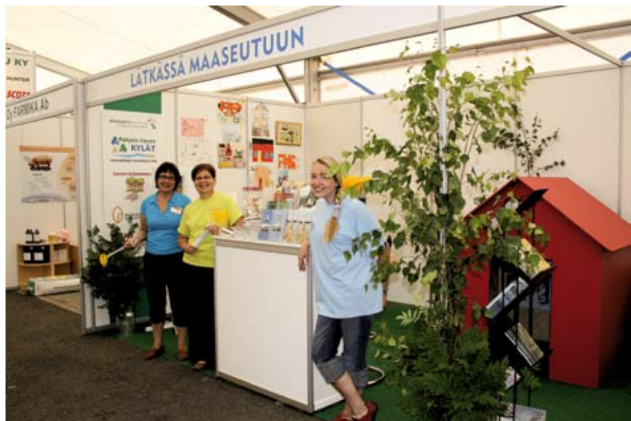
YTR esiintyi Farmari-maatalousnäyttelyssä Kuopiossa yhteisellä osastolla muiden maaseudun kehittäjien kanssa.