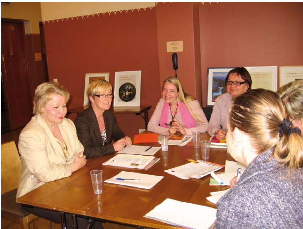
Naisten ääniä aluepolitiikassa -seminaarin osallistujia 30. toukokuuta 2007.