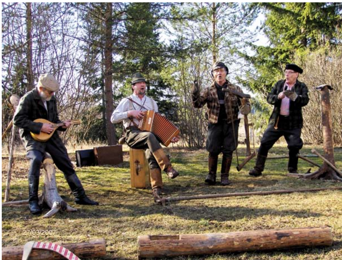
Pirkka-Hämeen Jätkäperinne ry:n porukka viihdyttää maaseutumatkailuyrittäjiä ja teemaryhmäläisiä Ilolan maatilamatkailutilalla Valkeakoskella.

Palvelua Sydämellä -verkoston toimintaa kehitettiin. Valmennusverkoston koulutuspäivät pidettiin Messilässä, Jämsässä ja Nuuksiossa sekä ajankohtaispäivä Tampereella. Päivien ohjelmassa oli koulutustaitojen kehittämistä, palvelun laadun parantamista, ajankohtaisia turvallisuusasioita ja tulevaisuuden suunnittelua. Vuoden 2007 aikana verkoston koordinoitiin ostettiin osittain JAKK Jalasjärveltä. PalveluaSydämellä -työ- ja käsikirja uusittiin, ja teemaryhmän sihteeri työsti siihen liittyvää valmentajan materiaalia. Myös TunneTurvaa