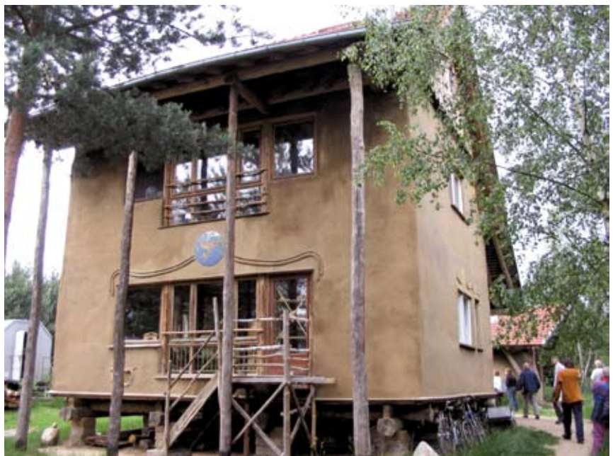
Savirapattu olkipaali- talo Siebenlindenissä Saksassa.

Teemaryhmä kokoontui viisi kertaa. Kokouksissa oli keskimäärin yhdeksän osallistujaa. Alkuvuodesta keskityttiin etenkin maankäytön suunnitteluun liittyviin kysymyksiin, joita vietiin eteenpäin työryhmien kautta. Vuoden lopulla keskityttiin maaseutupoliittisen selonteon ja kokonaisohjelman valmisteluun sekä seuraavan vuoden alussa pidettävän seminarin järjestelyihin. Lisäksi kokouksissa käsiteltiin mm. yhteistyökumppanin Onni muuttaa maalle -hankkeen etenemistä.