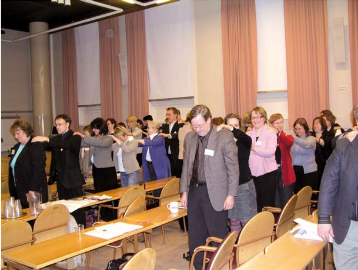
Elintarvikealan kehittäjät ehtivät myös rentoutumaan Porin seminaarissa.

Valtakunnallinen elintarvikealan kehittäjien hankeseminaari järjestettiin 6.–7. marraskuuta Porissa yhteistyössä Pyhäjärvi-instituutin kanssa. Seminaarissa noin 70 henkeä keskusteli toimialan ajankohtaisista kehittämisasioista.