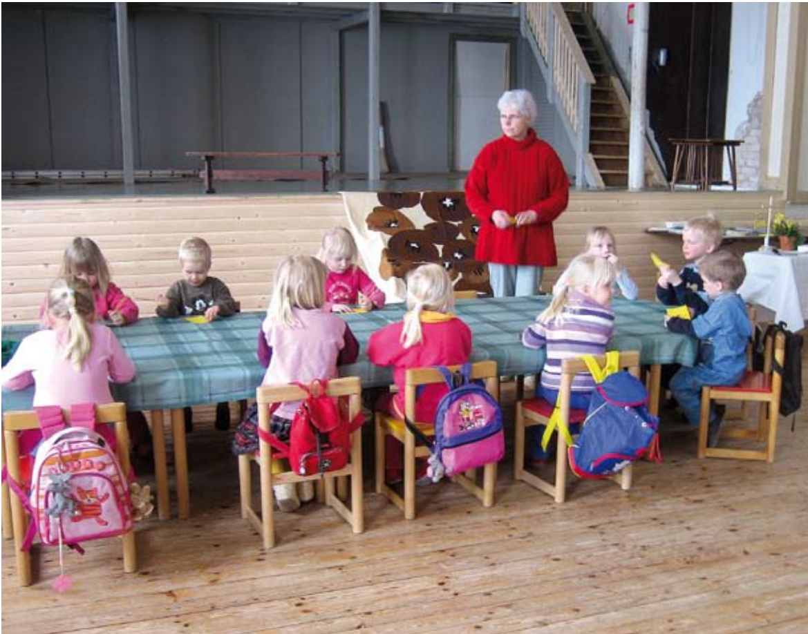
Lasten kerho seuraintalolla Itä-Uudellamaalla