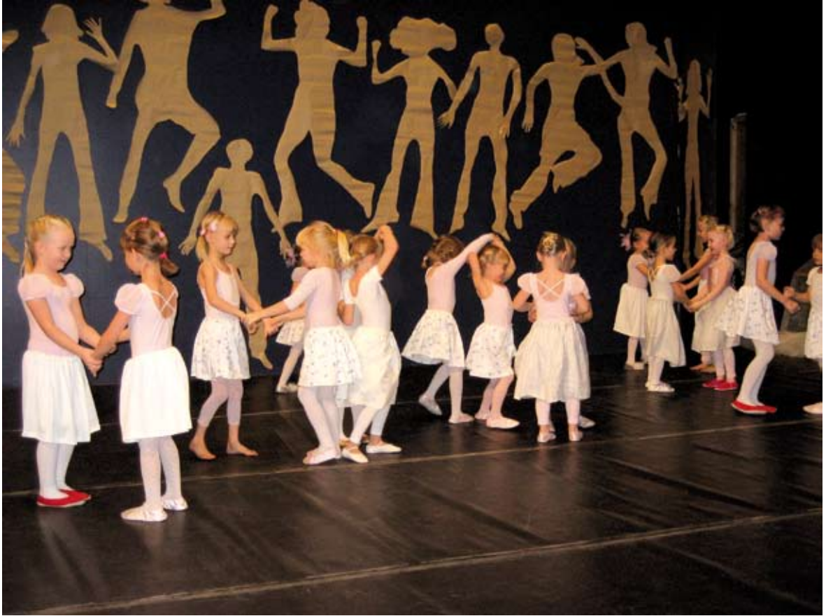
Kauhava-Härmän kansalaisopiston lasten satubalettiryhmä (4–5-vuotiaat) esiintyy opiston tanssitahtumassa.