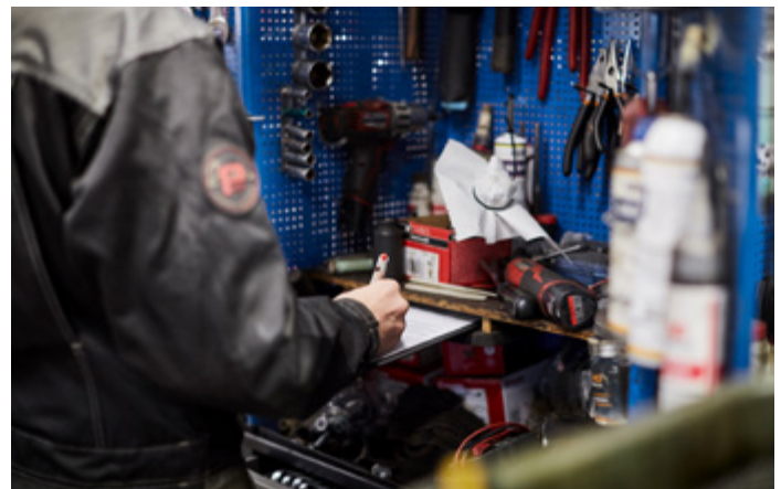
Digitaaliset oppimisympäristöt tärkeitä – mutteivät korvaa lähiopetusta

Maaseuduilla tulee edistää työpaikkaohjaajakoulutuksen helpompaa saatavuutta yritysten näkökulmasta. Maaseutualueilla tulee myös motivoida yrityksiä kouluttamaan henkilöstöään työpaikkaohjaajiksi.